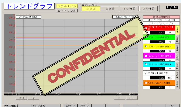
<トレンドグラフ画面>